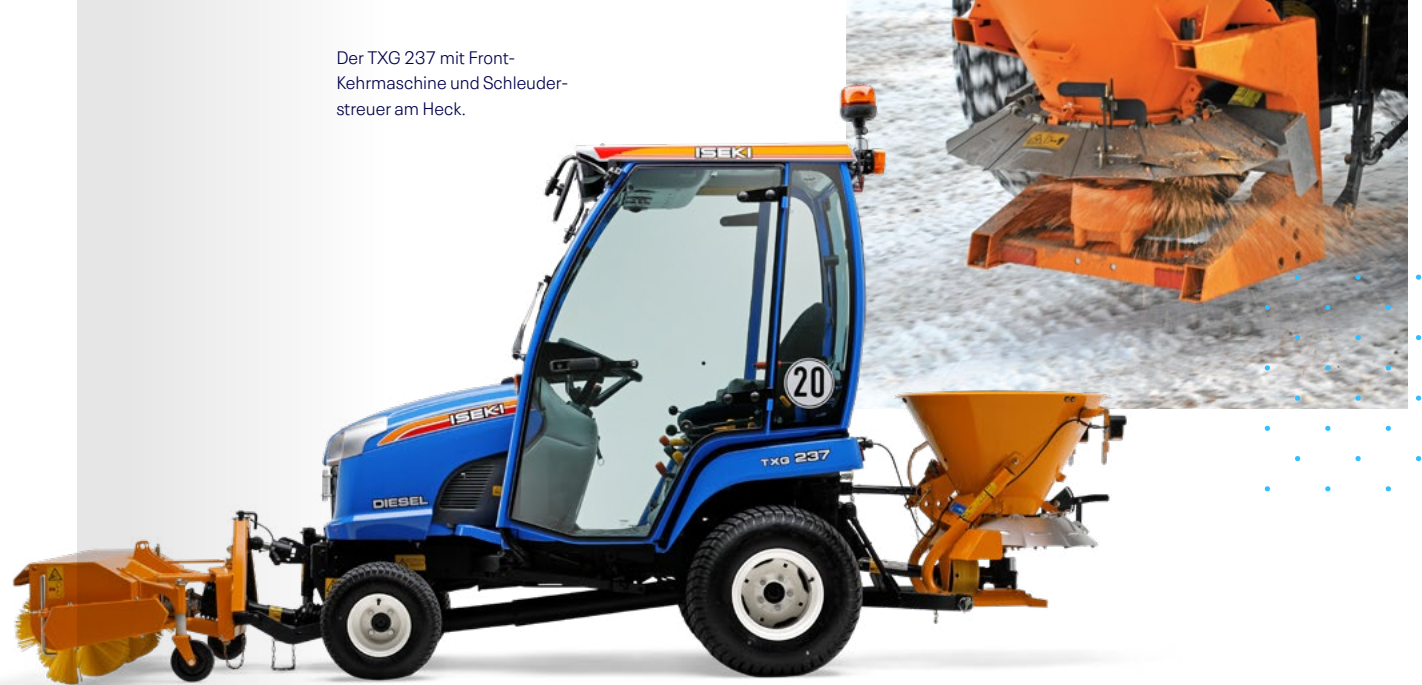
Der TXG 237 mit Frontkehrmaschine und Schleuderstreuer am Heck.